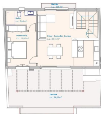
Planta Piso Tercera. Vivienda C.